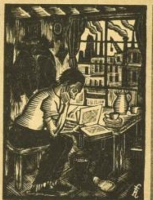
Illustration von Fritz Winter / Leipzig

NEUE BÜCHER DES MONATS 6. JAHRGANG 1929 HEFT 1