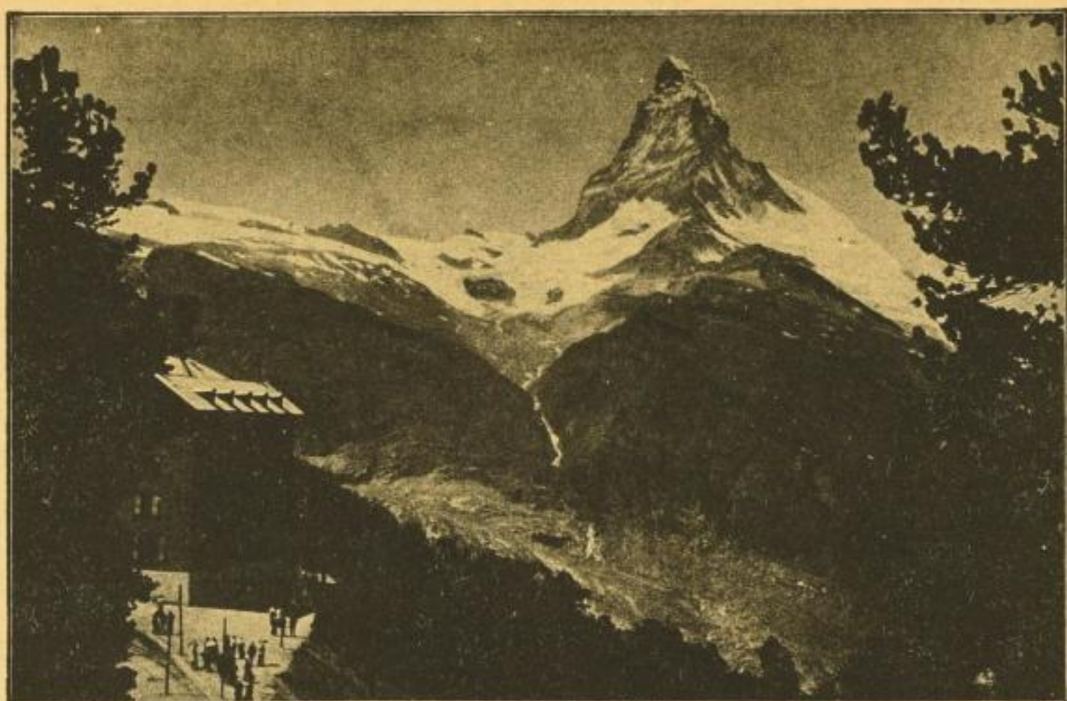
Matterhorn vom Riffelalp-Hotel.