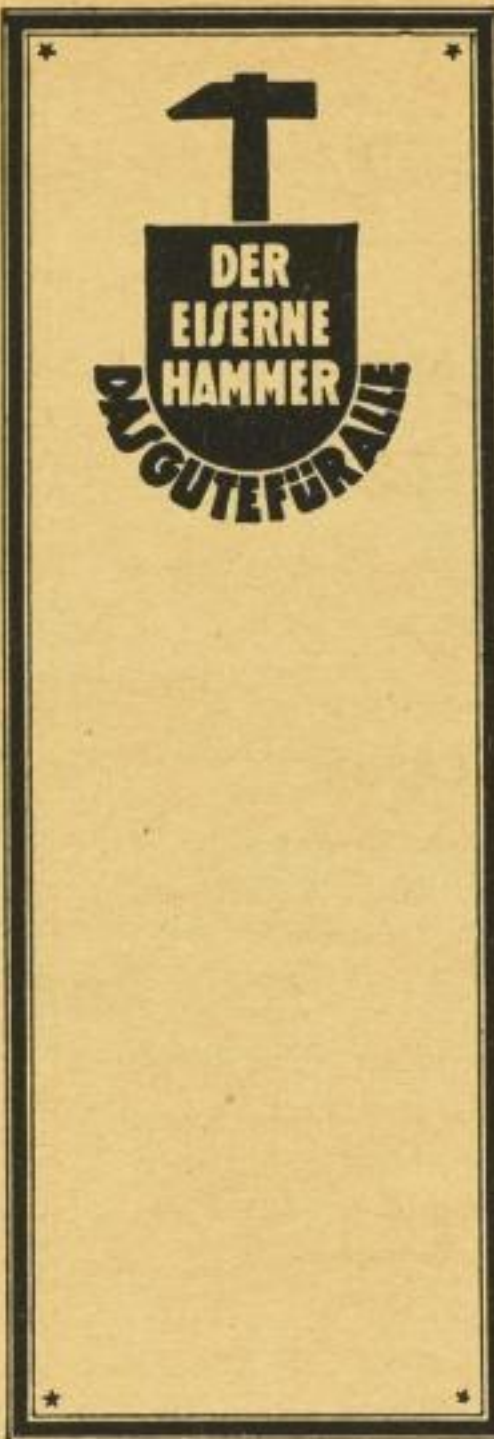
Verlag Der Eiserne Hammer