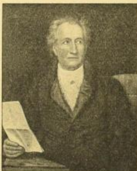
J. Stieler Goethe farbiger Aquarelldruck Brustbild, Bildgröße 56:68 cm Kopfbild, Bildgröße 26:36 cm