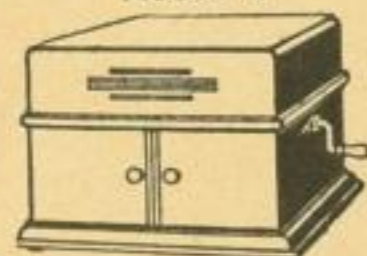
Fortuna-Schatulle Modell B

Fortuna-Schatulle Modell A wie nebenstehend abgebildet, Gehäuse 35 x 34 x 32 cm, Doppelfederwerk, Tonarm mit Klappbügel. Netto-Barpreis M. 40.—