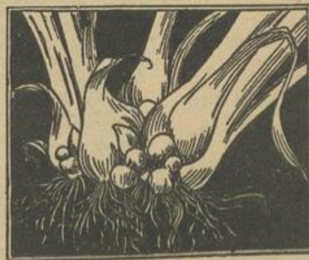
Wie Perlgwiebeln am Porree entstehen

Verlag Knorr & Hirth, G. m. b. H., München Sendlingerstraße 80