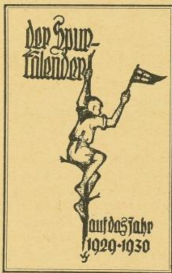
Verkleinertes Titelbild der letzten Ausgabe

Der eigentwüchsig, von der Jugend selbst gestaltete und in fünf Jahren bestens eingeführte Kalender gewinnt von Jahr zu Jahr mehr Freunde. Seine 6. Ausgabe widmet er den Fahrten zu den Deutschen im bedrohten Grenz- u. Ausland.