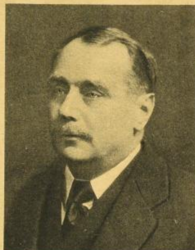
HERBERT G. WELLS

Bei einer Rundfrage des „Manchester Guardian“ unter seinen Lesern: „Wer ist der populärste Schriftsteller Englands?“ gingen als Sieger John Galsworthy mit 1180 Stimmen und H. G. Wells mit 993 Stimmen hervor. Nach ihnen folgte als dritter Rudyard Kipling mit 555 Stimmen.