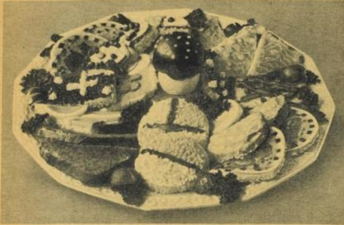
Platte mit Brötchen