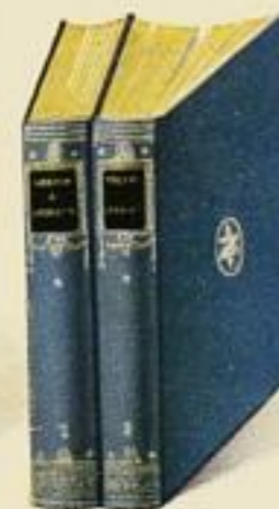
Jubiläumseinband von Goethes Werken, Festausgabe, blau Leinen mit Gelbschnitt