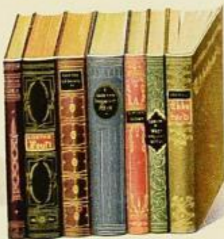
in Liebhaber-Leineneinbänden mit farbigem Schnitt