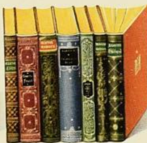
Sonderdrucke in Halbleder-Prachtbänden mit Goldoberschnitt