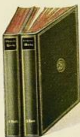
Grüner Leineneinband mit schwarzem Rückenschild, Goldaufdruck und Kopfschnitt