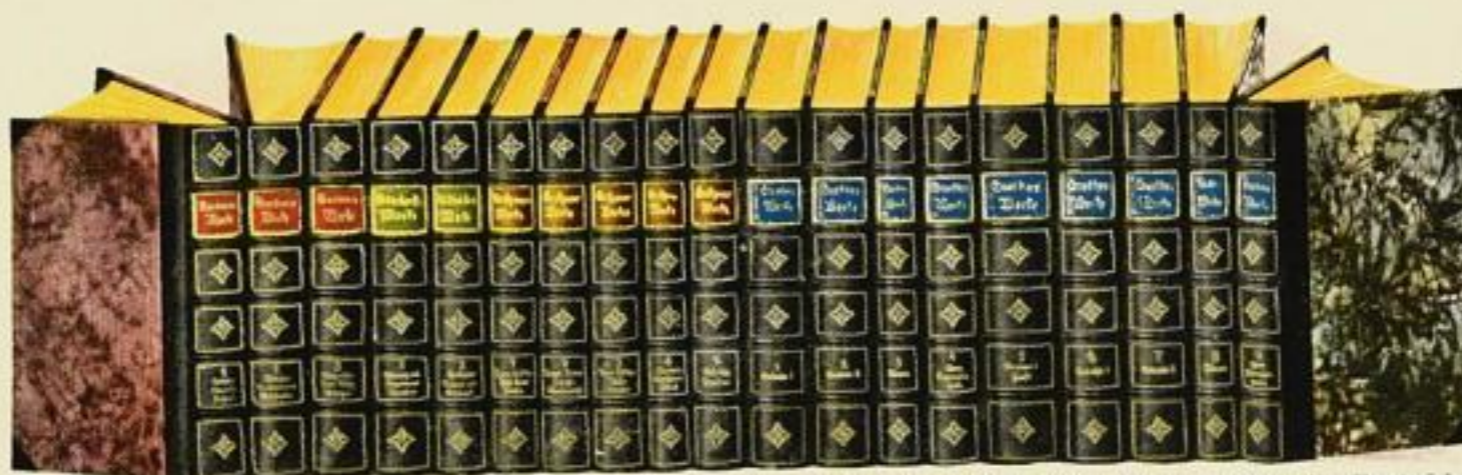
Diese 2 Reihen veranschaulichen den Halbledereinband. Zu dessen Herstellung werden bestes schwarzes Leder für Bandrücken und Ecken, 10 verschiedenfarbige Leder für die Rückenschilder, echtes Gold für Rückenprägung und für Kopfschnitt verwendet. Auf die Farbe der Rückenschilder ist der dauerhafte Überzugstoff der Einbanddecken abgestimmt.