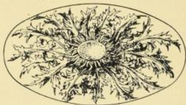
Stirn von Weidenröschen ( Carlina acutis )