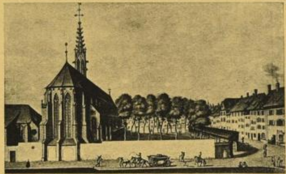
Der Totentanz von Basel im 18. Jahrhundert (Predigerkirche mit Friedhofsmauer)

Basel , Sitz der Bank für Internationalen Zahlungsausgleich