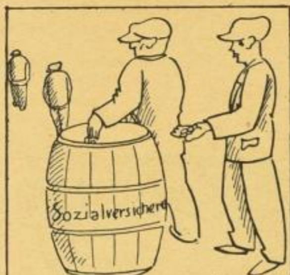
Wie man den Proletariern ehält