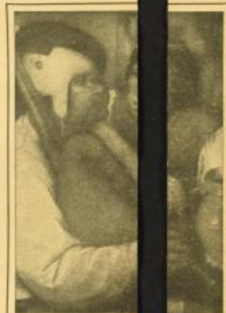
Tafel 24. Ausschnitt aus dem „Ernkornes“

KÄUFER: Bibliophile, Bibliotheken, Bibliothekare, Sammler, sämtliche Museen. Alle öffentlichen und privaten Sammlungen usw.