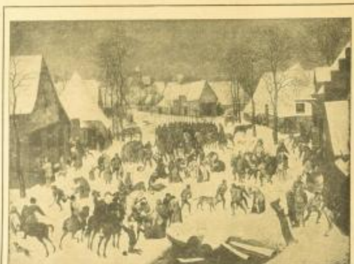
Tafel 19. Der Bethlehemitische Kindermord

Selten hat eine Monographie ihre Kreise soweit gezogen, von einem Punkt eine bestimmte Anschauungsweise und Geistesverfassung der bildenden Kunst so durchgreifend beleuchtet. Und schon dieser, im wahrsten Sinne des Wortes: Epochale Inhalt der Studie erhebt das Werk zu einer Erscheinung ersten Ranges. Nicht weniger seine Bildergabe. Das Wiener Hofmuseum besitzt von der Hand des älteren Bruegel eine Reihe von Gemälden, unvergleichlich an Zahl und Bedeutung. Vor allem mit ihnen hat Dvorák durch Jahre unmittelbaren, liebevollen Umgang gepflogen, vor allem aus ihnen hat er seine Erkenntnisse geschöpft. An diese herrliche Bilderfolge hat sich auch die Staatsdruckerei gehalten. Alle diese Gemälde sind im ganzen, aber auch Teile davon auf 31 Tafeln in Folio reproduziert und in einer Mappe gesammelt. Es sind 37 Farbenlichtdrucke, mit äußerster Sorgfalt hergestellt, neue Proben für die international längst anerkannte technische Kunst der Staatsdruckerei, die sich hier an einem besonders geeigneten Stoffe — den farbenklaren und farbenprächtigen Werken des niederländischen Meisters, bewähren konnte.