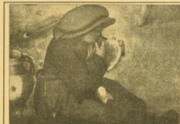
Tafel 27. Ausschnitt aus der „Bauernhochzeit“

Firmen, die sich für den Vertrieb besonders intensiv einsetzen und eine umfassende Propagandatätigkeit in Aussicht nehmen wollen, werden weitestgehende Bezugsbedingungen gewährt, und werden ersucht, sich mit dem Verlag unverzüglich ins Einvernehmen zu setzen