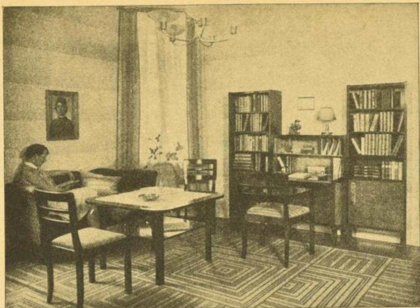
AUS DEM WK-AUFBAUHEIM