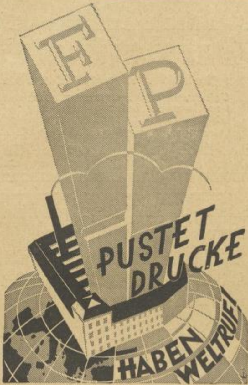
Friedrich Pustet, Graphischer Großbetrieb, Regensburg

D C. DOELLE & SOHN HALBERSTADT • GEGR. 1549