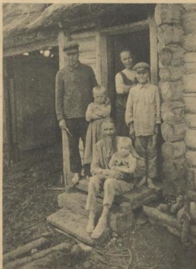
Aus: Stratil-Sauer, Erlebnisse Familie eines Kleinbauern längs russischer Landstraßen

Rußland, von einem meisterlichen Stilisten in all seiner Mannigfaltigkeit erfaßt und geschildert.