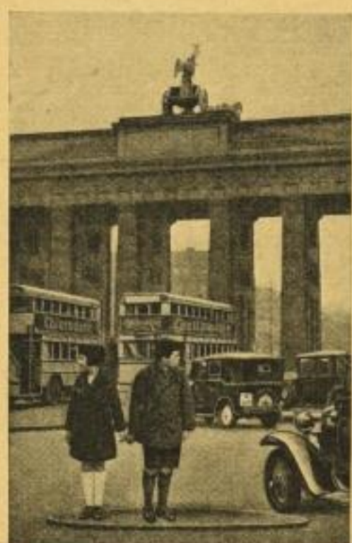
Am Brandenburger Tor