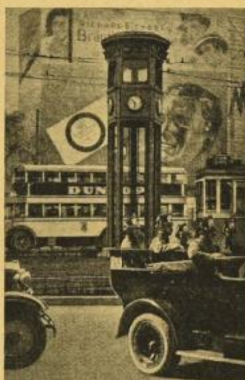
Am Leipziger Platz