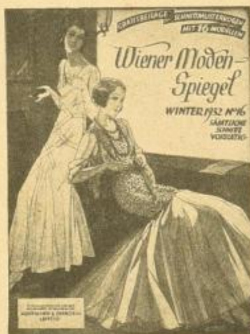
Wiener Modenspiegel . . 1.50 mit Schnittbogen