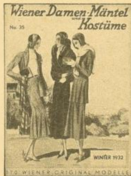
Wiener Damenmäntel und Kostüme . . . . . 2.75