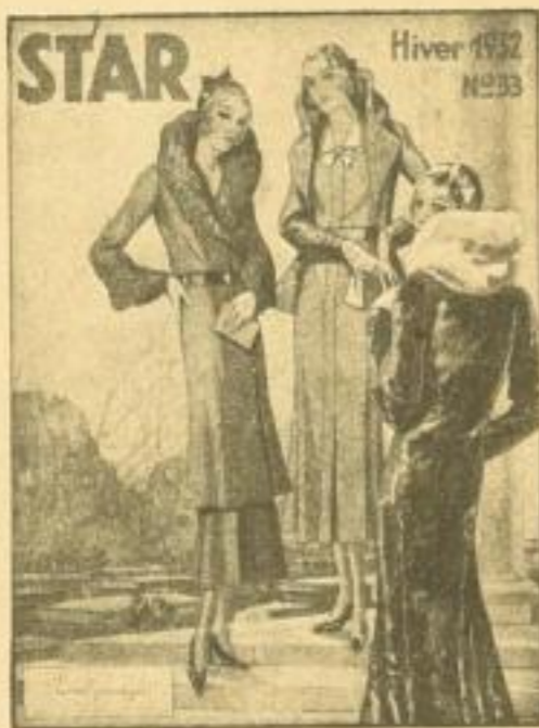
Star . . . . . 3.—