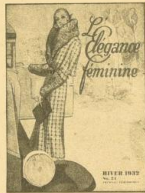
L'Élégance féminine . . 1.80 mit Schnittbogen