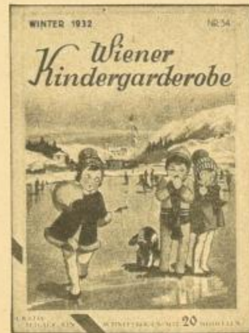
Wiener Kindergarderobe 1.80