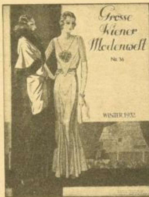
Große Wiener Modenwelt 2.—