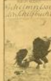
SCHIMMELSCHNITZER Die Schöne und der Hüne ... erzählt die Geschichte von der Schönen und dem Hünen. R. 9-12. 1.50 RM