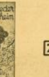
Die Schöne und der Hüne ... erzählt die Geschichte von der Schönen und dem Hünen. R. 9-12. 1.50 RM

Witzf. farb. Schaufensterplakate, Stellbilder u. Prospekte nach Maßgabe gleich. Bestellungen umsonst