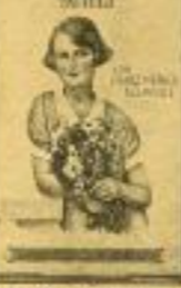
Die Schöne und der Hüne ... erzählt die Geschichte von der Schönen und dem Hünen. R. 9-12. 1.50 RM