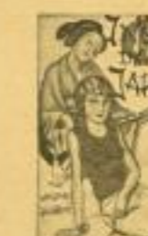
Die Schöne und der Hüne ... erzählt die Geschichte von der Schönen und dem Hünen. R. 9-12. 1.50 RM