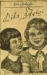
Die Schöne und der Hüne ... erzählt die Geschichte von der Schönen und dem Hünen. R. 9-12. 1.50 RM