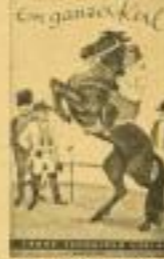
Die Schöne und der Hüne ... erzählt die Geschichte von der Schönen und dem Hünen. R. 9-12. 1.50 RM