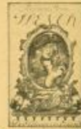
Die Schöne und der Hüne ... erzählt die Geschichte von der Schönen und dem Hünen. R. 9-12. 1.50 RM