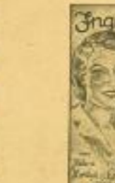
Die Schöne und der Hüne ... erzählt die Geschichte von der Schönen und dem Hünen. R. 9-12. 1.50 RM