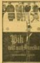
Die Hühner, die auf einem Caracampfer sind ... erzählt die Geschichte von den Hühnern, die auf dem Caracampfer sind. R. 9-12. 1.50 RM