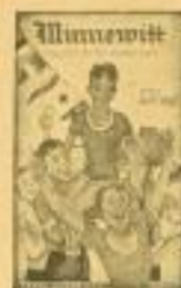
Mummensitt. Eine sehr witzige Geschichte über die Mummensitt. R. 9-12. 1.50 RM