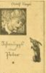
Die Schöne und der Hüne ... erzählt die Geschichte von der Schönen und dem Hünen. R. 9-12. 1.50 RM