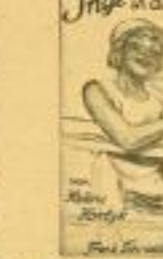
Die Schöne und der Hüne ... erzählt die Geschichte von der Schönen und dem Hünen. R. 9-12. 1.50 RM