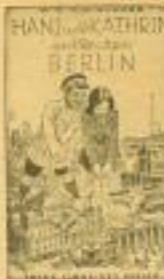
HANI KATHRIN in der Stadt BERLIN ... erzählt die Geschichte von der Hani Kathrin in der Stadt Berlin. R. 9-12. 1.50 RM