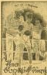
Peter macht die Kanne ... erzählt die Geschichte von Peter, der die Kanne macht. R. 9-12. 1.50 RM