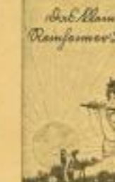
Die Schöne und der Hüne ... erzählt die Geschichte von der Schönen und dem Hünen. R. 9-12. 1.50 RM