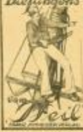
Die Schöne und der Hüne ... erzählt die Geschichte von der Schönen und dem Hünen. R. 9-12. 1.50 RM