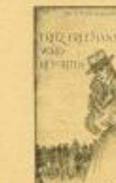
Die Schöne und der Hüne ... erzählt die Geschichte von der Schönen und dem Hünen. R. 9-12. 1.50 RM