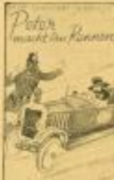
Auf Leben und Tod ... erzählt die Geschichte von einem Mann, der auf Leben und Tod geht. R. 9-12. 1.50 RM