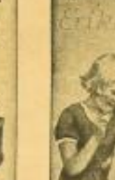
Die Schöne und der Hüne ... erzählt die Geschichte von der Schönen und dem Hünen. R. 9-12. 1.50 RM