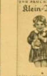
Die Schöne und der Hüne ... erzählt die Geschichte von der Schönen und dem Hünen. R. 9-12. 1.50 RM