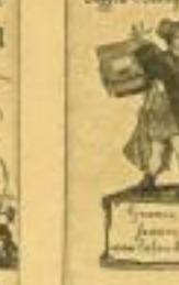
Die Schöne und der Hüne ... erzählt die Geschichte von der Schönen und dem Hünen. R. 9-12. 1.50 RM