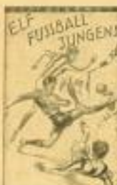
Elf Fußball Jungen ... erzählt die Geschichte von elf Fußball Jungen. R. 9-12. 1.50 RM