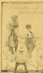
Die Schöne und der Hüne ... und erzählt die Geschichte von der Schönen und dem Hünen. R. 9-12. 1.50 RM