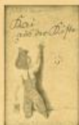
Das ist die Duffe, die mit dem Wasserschlauch einen sehr Witzigen auf den Kopf. R. 9-12. 1.- RM