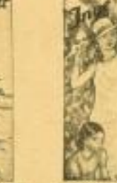
Die Schöne und der Hüne ... erzählt die Geschichte von der Schönen und dem Hünen. R. 9-12. 1.50 RM