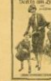
Die Schöne und der Hüne ... erzählt die Geschichte von der Schönen und dem Hünen. R. 9-12. 1.50 RM