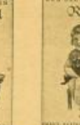
Die Schöne und der Hüne ... erzählt die Geschichte von der Schönen und dem Hünen. R. 9-12. 1.50 RM