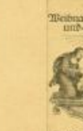
Die Schöne und der Hüne ... erzählt die Geschichte von der Schönen und dem Hünen. R. 9-12. 1.50 RM