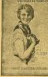
Die Schöne und der Hüne ... erzählt die Geschichte von der Schönen und dem Hünen. R. 9-12. 1.50 RM