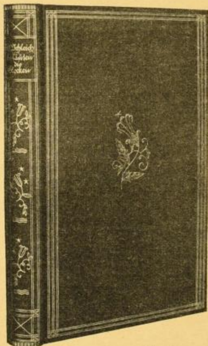
Abbildung der Original-Ausgabe Geschenk-Ausgabe (132×205 mm)

Die Neue Erziehung Monatsschrift des „Bundes Entschiedener Schulreformer“, Aug. 1931