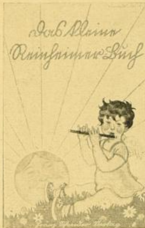
85.—87. Lfd. 2 RM

Trotz vorsorglichster Disposition auf Grund vorjähriger Statistik gehen die Bestände unseres Lagers vorschnell zu Ende. Wir haben deshalb noch zuletzt