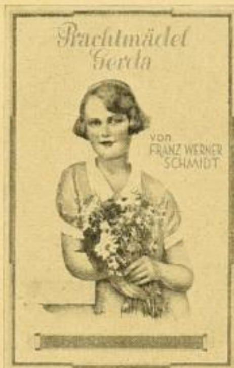
22.—24 Lfd. 3.80 RM