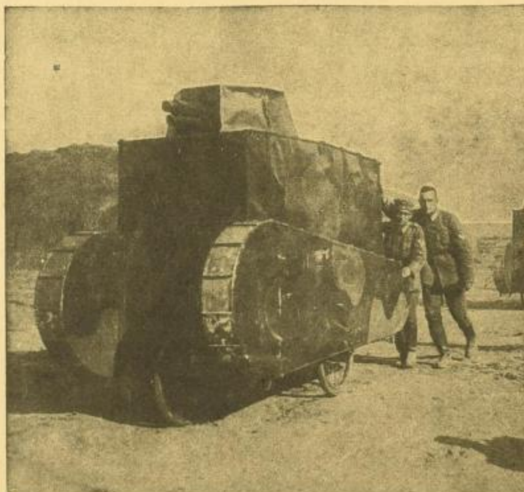
DEUTSCHE PAPTANKS BEI DEN REICHSWEHRMANÖVERN

Bestellen Sie noch heute einige Fünf-Kilo-Paketel