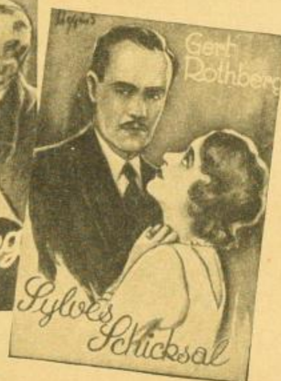
Format jedes Bandes: 12,5x18,5 cm