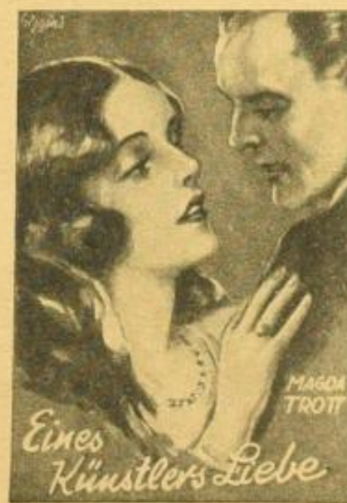
Ⓢ Durchschnittlicher Umfang jedes Bandes: ca. 250 Seiten Ⓢ