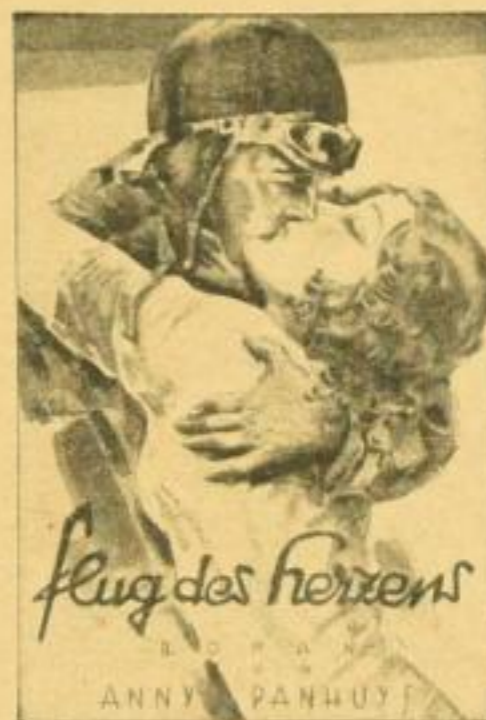
Abbildungen der mehrfarbigen, lackierten Schutzumschläge