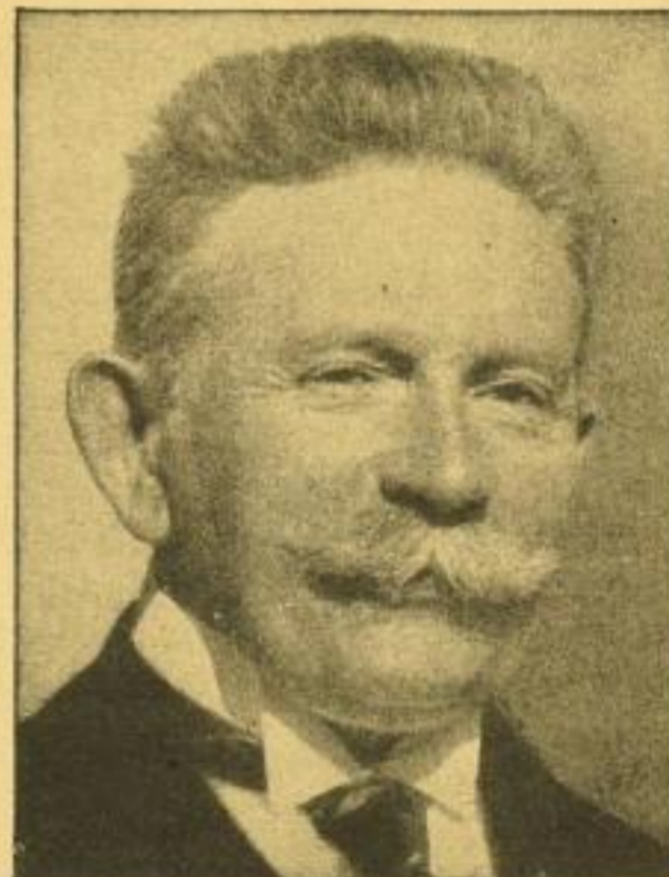
HUGENBERG. Von Dr. Otto Kriegk, Spezial-Berichterstatler des Hugenberg-Konzerns. 104 Seiten, 20 Fotos. Kartoniert 1.80 RM, Leinen 2.80 RM.