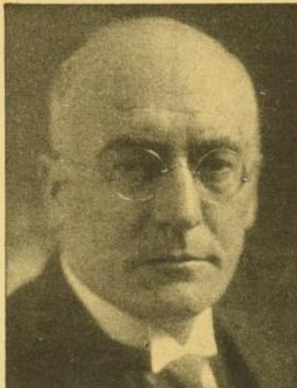
BRÜNING. Von Dr. Alphons Nobel, Chefredakteur des „Deutschen“. 96 Seiten, 23 Fotos. Kartoniert 1.50 RM, Leinen 2.50 RM.