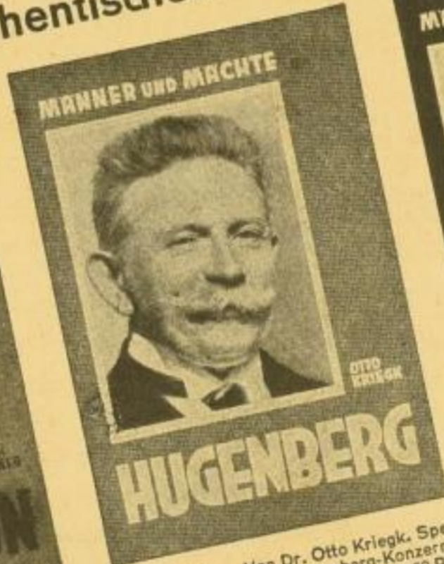
HUGENBERG. Von Dr. Otto Kriegk, Spezialberichterstatter d. Hugenberg-Konzerns 104 S., 20 Fotos. Kart. 1.50 RM, Ln. 2.50 RM