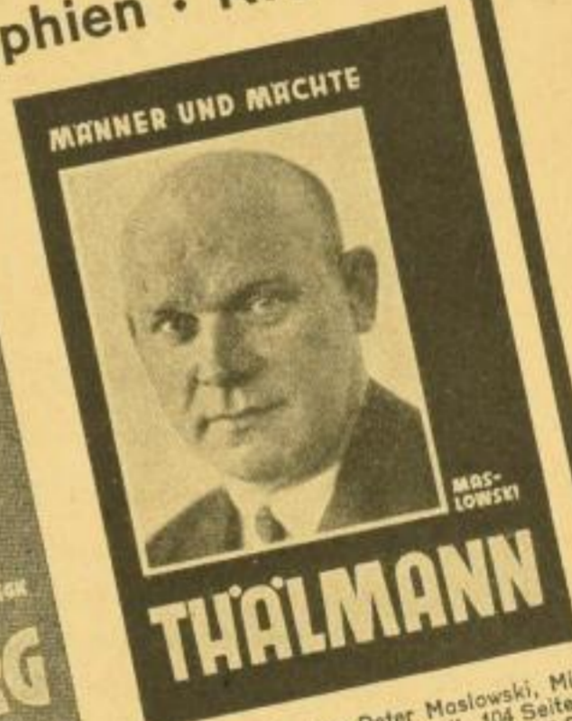
THÄLMANN. Von Peter Maslowski, Mitarbeiter der „Roten Fahne“. 104 Seiten, 22 Fotos. Karton. 1.50 RM, Leinen 2.50 RM