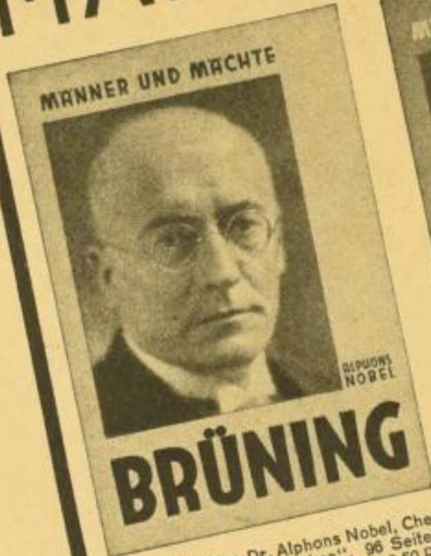
BRÜNING. Von Dr. Alphons Nobel, Chefredakteur des „Deutschen“. 96 Seiten, 23 Fotos. Karton. 1.50 RM, Leinen 2.50 RM