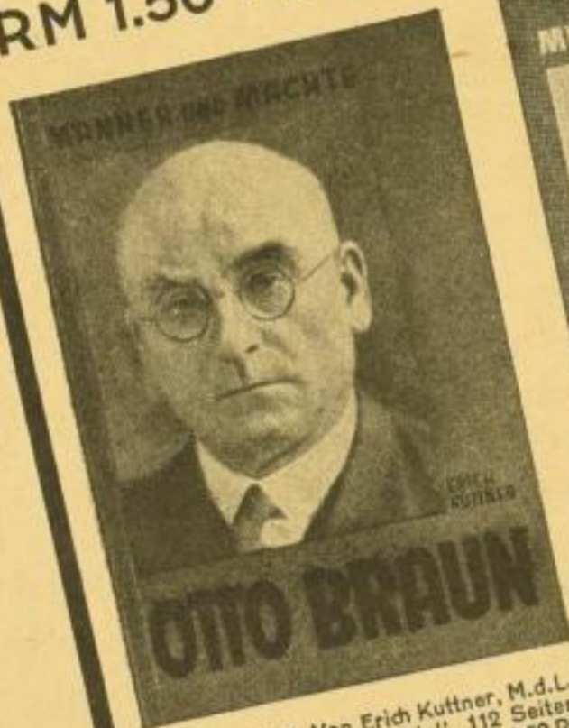
OTTO BRAUN. Von Erich Kuttner, M.d.L., Mitarbeiter des „Vorwärts“. 112 Seiten, 15 Fotos. Karton. 1.50 RM, Leinen 2.50 RM

RM 1.50 • Die authentischen Biographien • RM 1.50