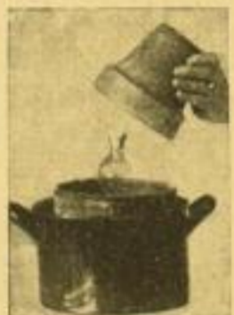
Küchen der Milch.

Wega-Verlag, München 2 SW, Hermann-Schmid-Straße 1