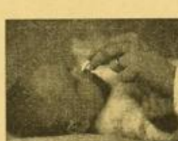
Austupfen der Nase.