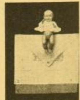
Der richtige Wickel.