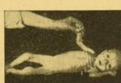
Schwer ernährungsgefordertes Kind.