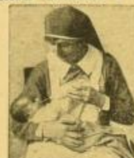
Richtiges Geben d. Flasche.