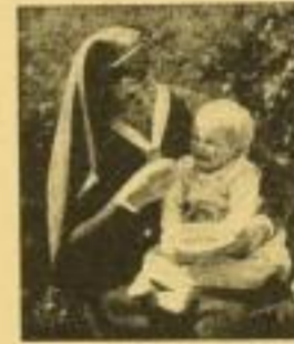
Richtiges Geben von Brot.