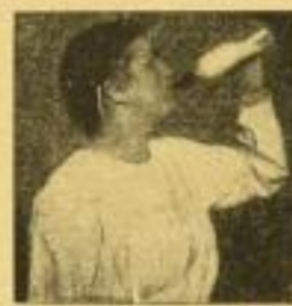
Falsches Versuchen v. Milch.