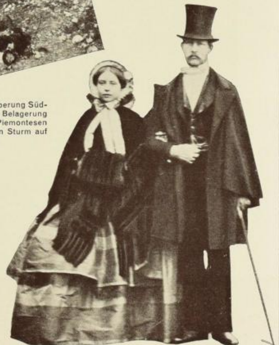
Ein politisches Ereignis der Zeit: Der Kronprinz von Preußen, der spätere Kaiser Friedrich, heiratet die Tochter der Königin Victoria von England am 25. Januar 1858

8 Seiten Vorwort, 136 Abbildungen (nach Originalphotos) auf 131 Seiten • 4 o • In Leinen RM. 6.80