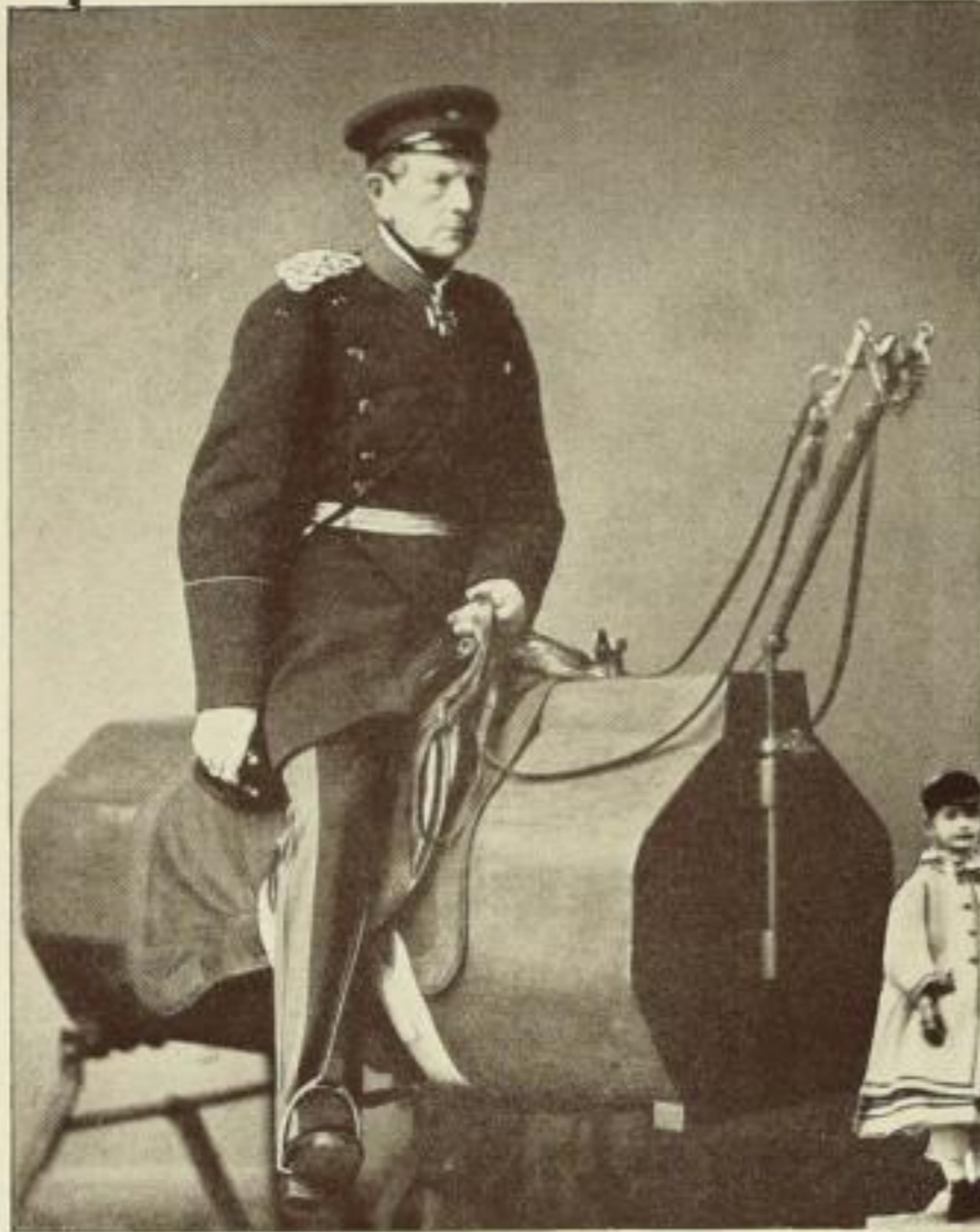
Graf Moltke auf dem Holzpferd: Die Aufnahme, die im Atelier Anton v. Werners gemacht wurde, zeigt den Feldmarschall als Modell für das Gemälde „Graf Moltke vor Paris“. — 1871

Rechts: Der Abschluß eines tragischen Lebens: Aufbahrung Ludwigs II. von Bayern, der am 13. Juni 1886 in geistiger Umnachtung Selbstmord beging. — 1886