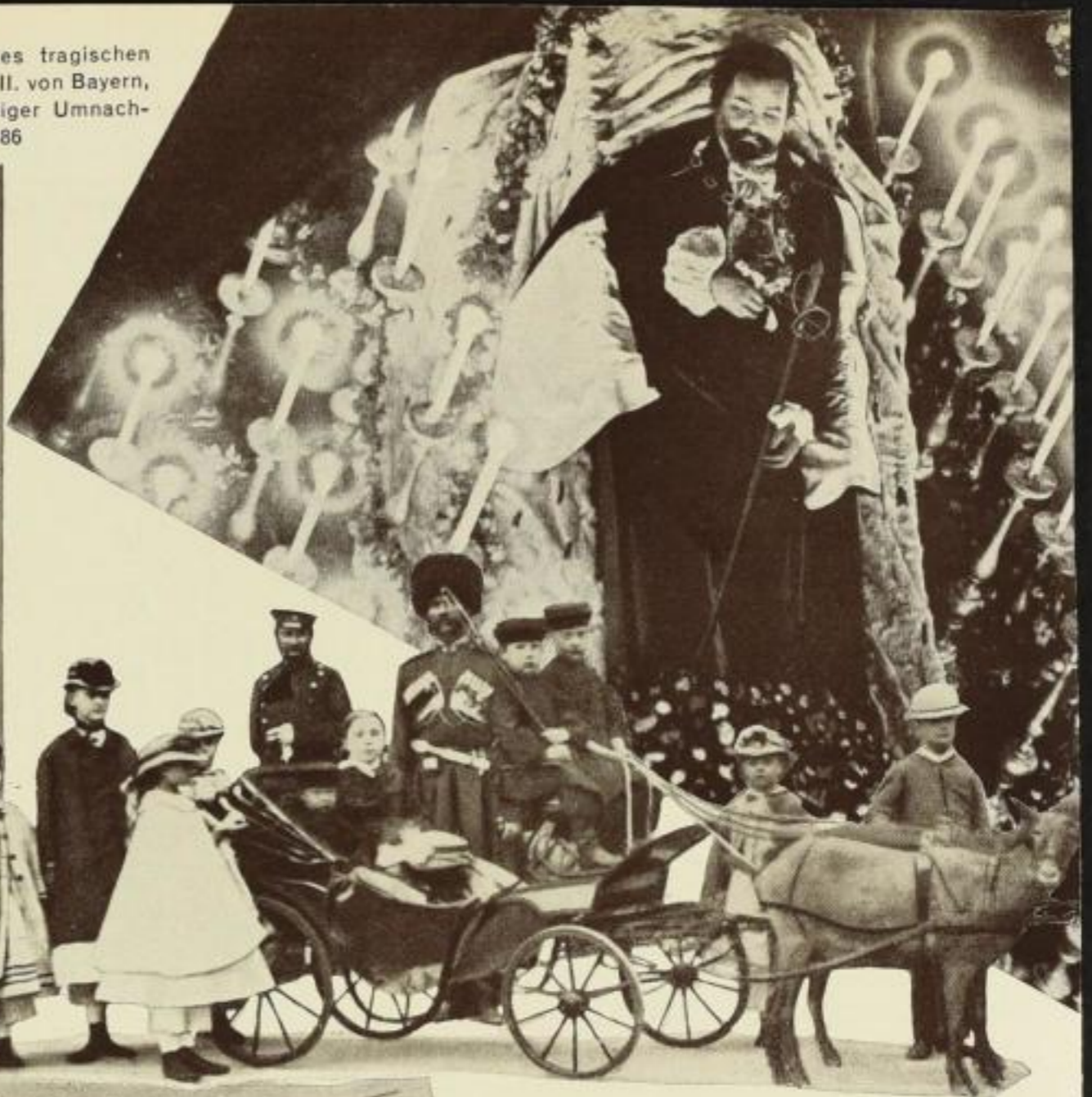
Eine der ersten russischen Freilichtaufnahmen um 1860