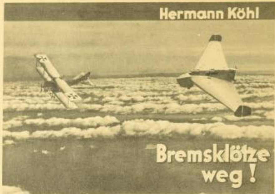
Vorder- und Rückseite des Schutzumschlages. Ausführung in Zweifarbendruck. Größe des Buches 16 x 22 cm.