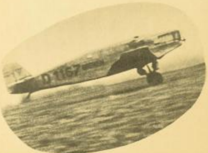
Die „Bremen“ startet im Morgenrauschen in Baldonnell zu dem Flug über den Ozean.