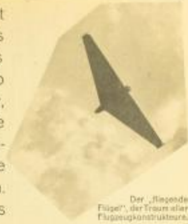
Der „fliegende Flügel“, der Traum aller Flugzeugkonstruktoren.

und seinen Kameraden zu. Er bleibt bescheiden, bleibt an seinem Lebensziele hängt: die Luftfahrt vorwärts zu treiben. – Von dem Kadettenkorps wird er zu den Fliegern überführt. Er bringt den Bombardementen die höchste militärische Auszeichnung. Am gleichen Tage muß er hinter den französischen Linien in ein Lager. Die Flucht nach mehreren Versuchen. Sechs Tage lang läuft er durch Frankreich, verfolgt von Steckbriefen, gepöbelt von Hunger, unkundig der Landessprache. Schließlich über die Rhône, erreicht die Schweiz und ist für eine fliegerstaffel, dann Kompanie-Chef bei der Reichswehr. Doch der Flieger