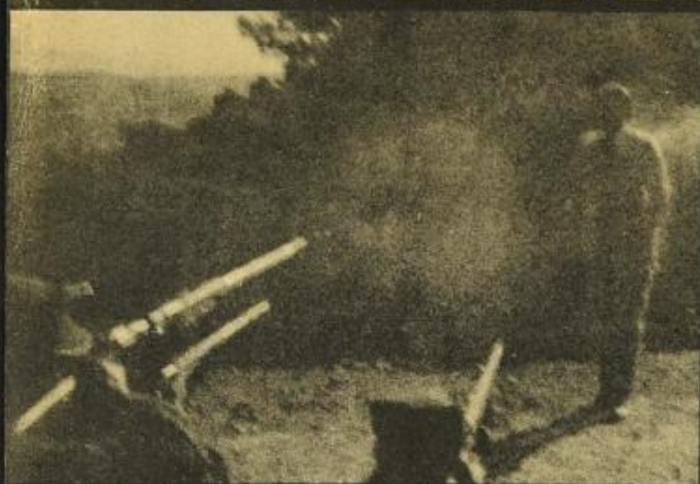
„Legt an . . .“