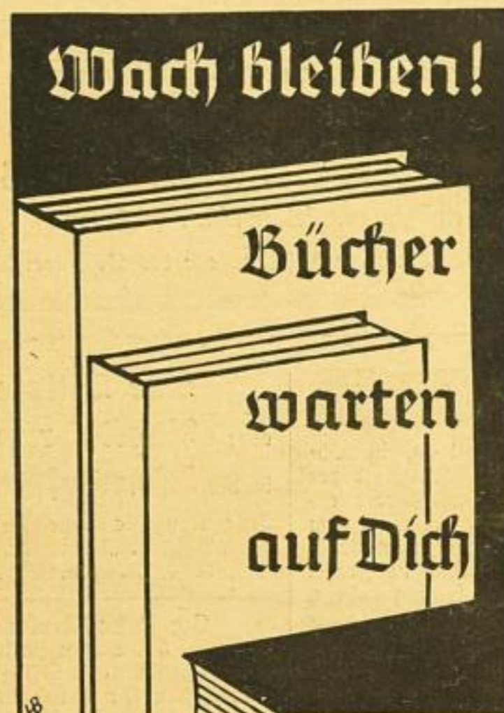
Mater Nr. 17

«Neues aus Zeitschriften» zusammengestellt von Walter Jäger.