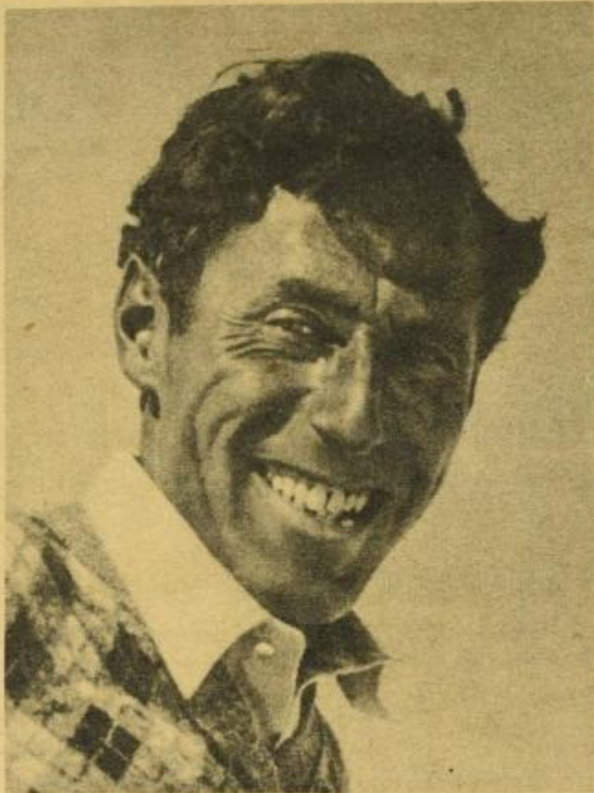
Hannes Schneider in bester Laune

Das erste und einzige Skibuch vom Arlberg, die Skiläufer warten darauf!