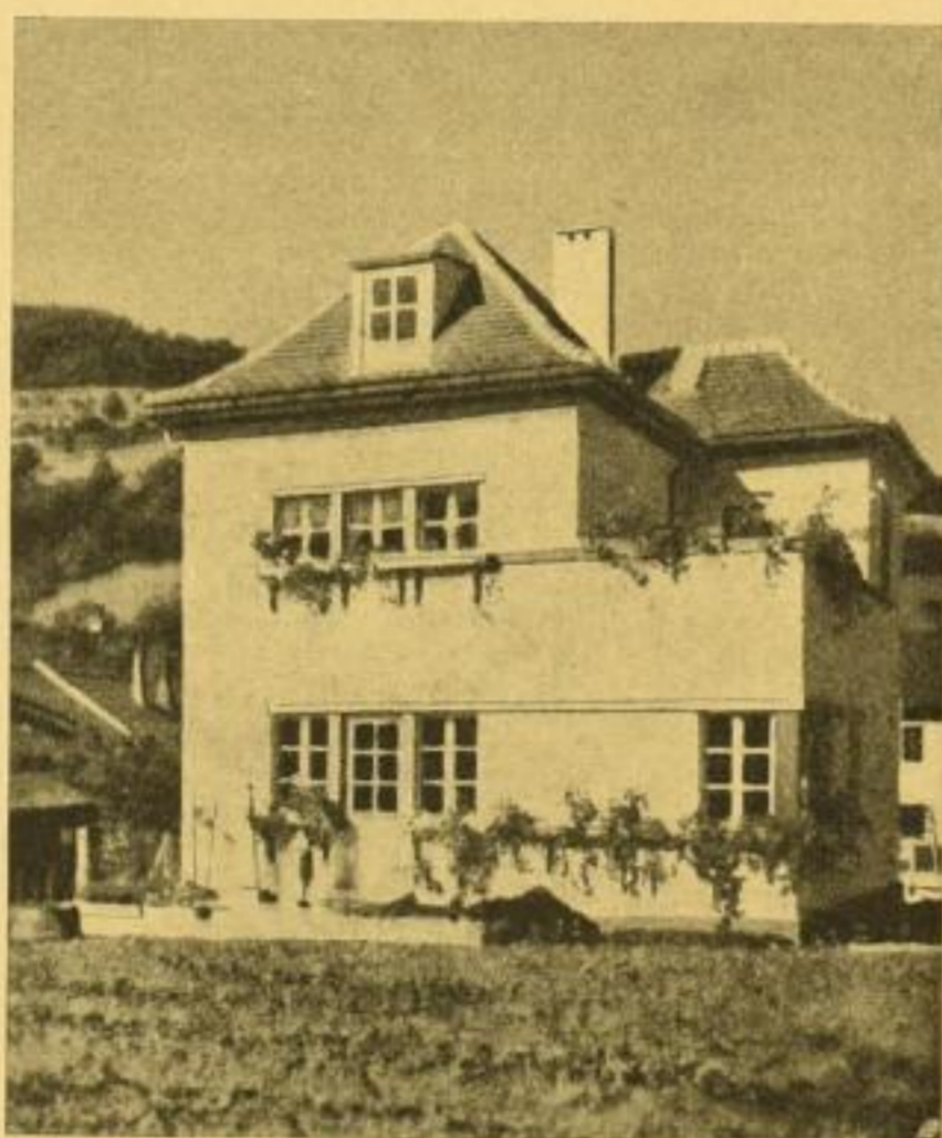
„Der Stolz eines Siedlers“

Hugo Bermühler Verlag / Berlin-Lichterfelde