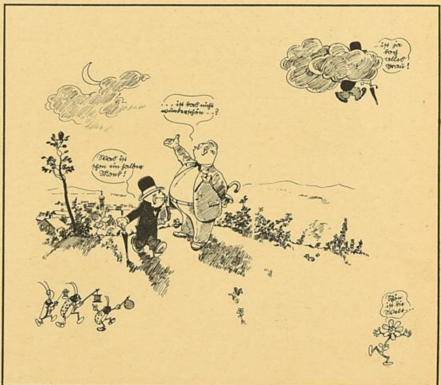
Etwa 1/2 der Originalgröße

Was meinen Sie? Das sei nur Kausch? Nur Illusion? Ein schlechter Lausch? Jawohl ein Kausch, Sie Pessimist! Doch: wie das Leben wirklich ist, das zeigt er! Leben — welche Wonne in einer Welt voll Glück und Sonne! Es wär' für Sie, mein Herr, von Nutzen, die Brillengläser sich zu putzen.