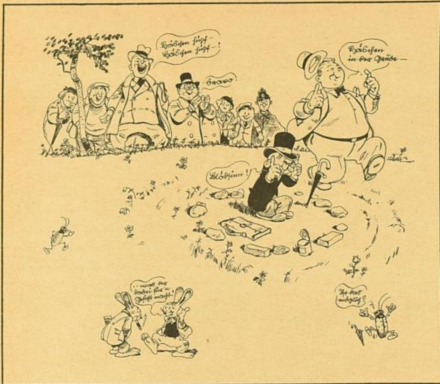
Etwa 1/2 der Originalgröße

Und nun: wär'n Sie dazu gewillt, mit mir zu spielen, wie im Bild?