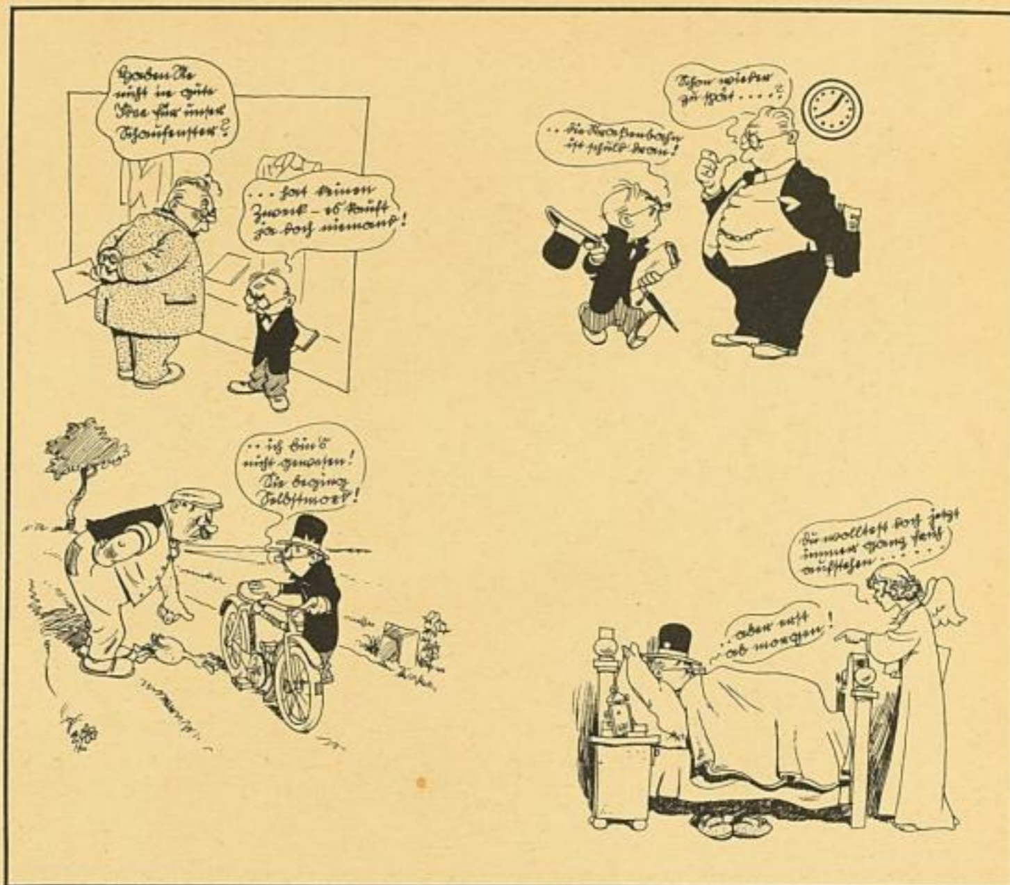
Etwa 1/2 der Originalgröße

Ausreden! Das ist auch so'n Kapitel! Darum sind Sie ja nie verlegen! Das ist ein ganz wunderbares Mittel, sich zu drücken vor lästigen Wegen! Dumm, daß wir nicht in der Schule sitzen! O, dann hämmerte ich's Ihnen ein, ließe Sie schreiben, bis daß Sie schwißen: „Ich soll doch nicht so träge sein!“ Denn Ihr Pessimismus, mein Lieber, ist ja nur Trägheit — zu neunzig Prozent! Es erscheint die Welt umso trüber, je mehr man von seinen Chancen verpennt. Aufgewacht, edler Fürst! Und Optimist sein! Zugepaßt! Ausweichen ist nicht erlaubt! Ausreden können noch so voll List sein — keine hilft, daß Dir Dein Herz nicht verstaubt!