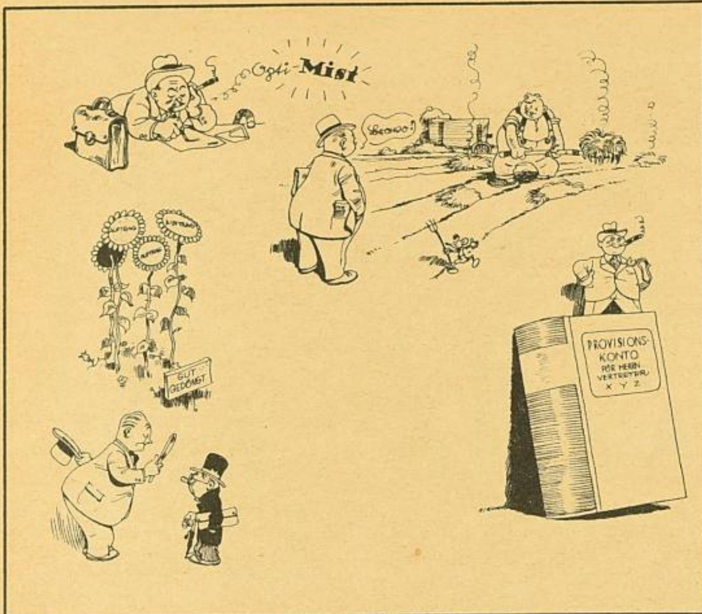
Etwa 1/2 der Originalgröße