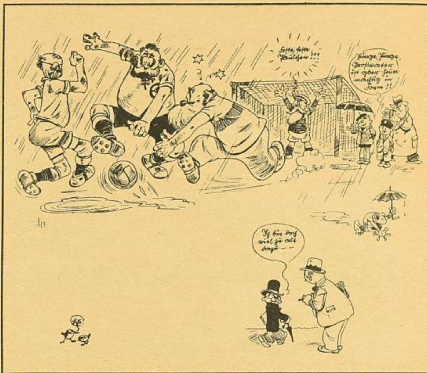
Etwa 1/2 der Originalgröße

Und ebenso wie mit der Welt ist's mit uns Menschen auch bestellt, Der Körper, ja, der wird wohl älter. Doch wird das Herz dabei auch kälter, dann liegt das an uns selber nur! An unsrer eignen Pfuscherkur! „Ich bin zu alt dazu!“ Herrje! Hör' ich das, tut der Bauch mir weh! Sehn Sie sich nur im Bilde an, was selbst der Opapa noch kann, wenn er nur, wie es sich gehört, mit Unkerei sich nie beschwert. Mein Herr, der Kost in unsern Knochen kommt nur vom Mecker-suppe kochen!! „Zu alt dazu?“ Halt' er das... Ausrede, Herr — Herr Oberfaul!