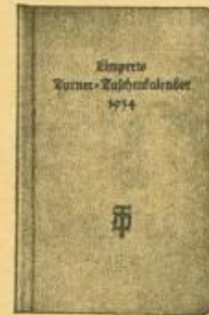
Stückpreis 50 Pfg.