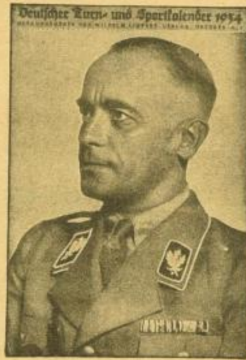
Stückpreis RM 2.—