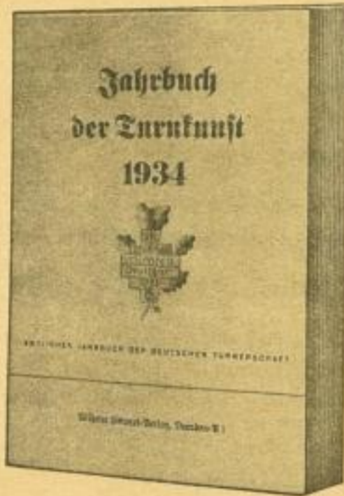
brosch. RM 1.50 geb. RM 2.50

in Turn- und Sportvereinen und bei allen Freunden deutscher Leibesübungen bieten diese drei Jahreserscheinungen