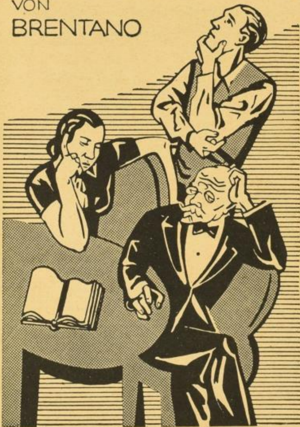
Verkleinerte Wiedergabe des mehrfarbigen Schutzumschlages (Rückseite)