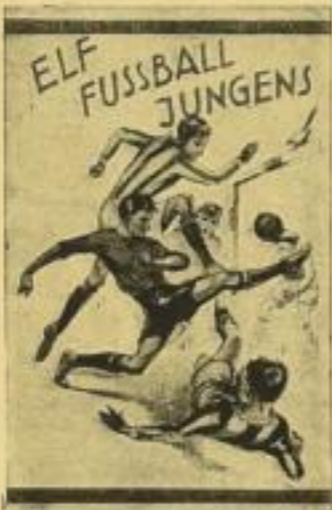
20. Tfd. 2.50 RM