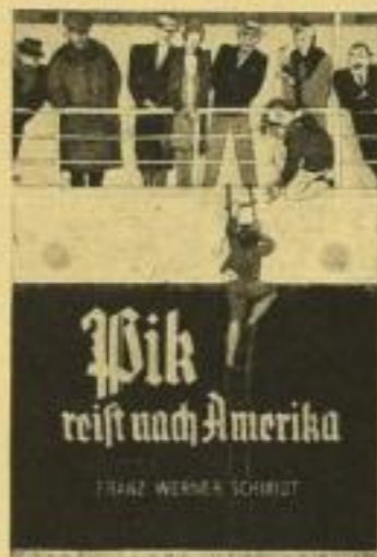
37. Tfd. 2.50 RM