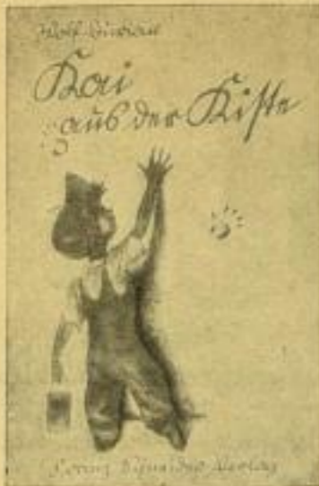
53. Tfd. 2.— RM

Umsatz im Jahre 1933: 366 308 Bände Werktäglich also fast: 1200 Bände