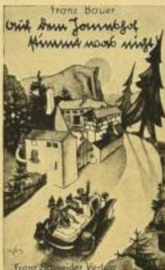
16. Tfd. 1.30 RM