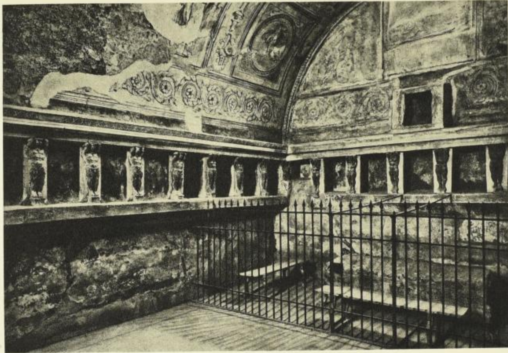
Heißluftbad. Das Tepidarium der Pompeianer Thermen.