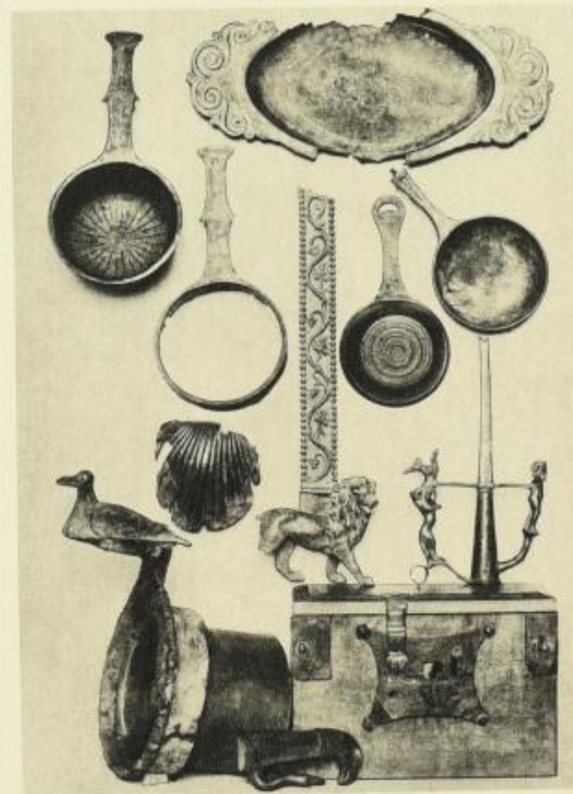
Herd und Küchengeräte aus der römischen Kaiserzeit. Trier, Provinzialmuseum.

ILLUSTRATIONSPROBEN AUS DEM WERK PHAIDON-VERLAG