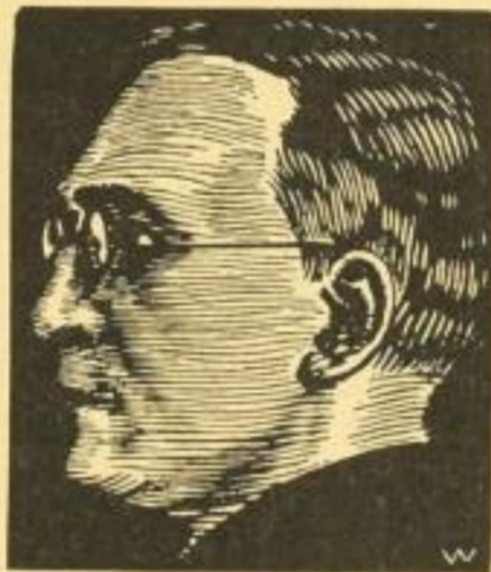
Blickfang/Umschlag RM 1.20

Das aktuellste Buch der Welt und Gegenwart.