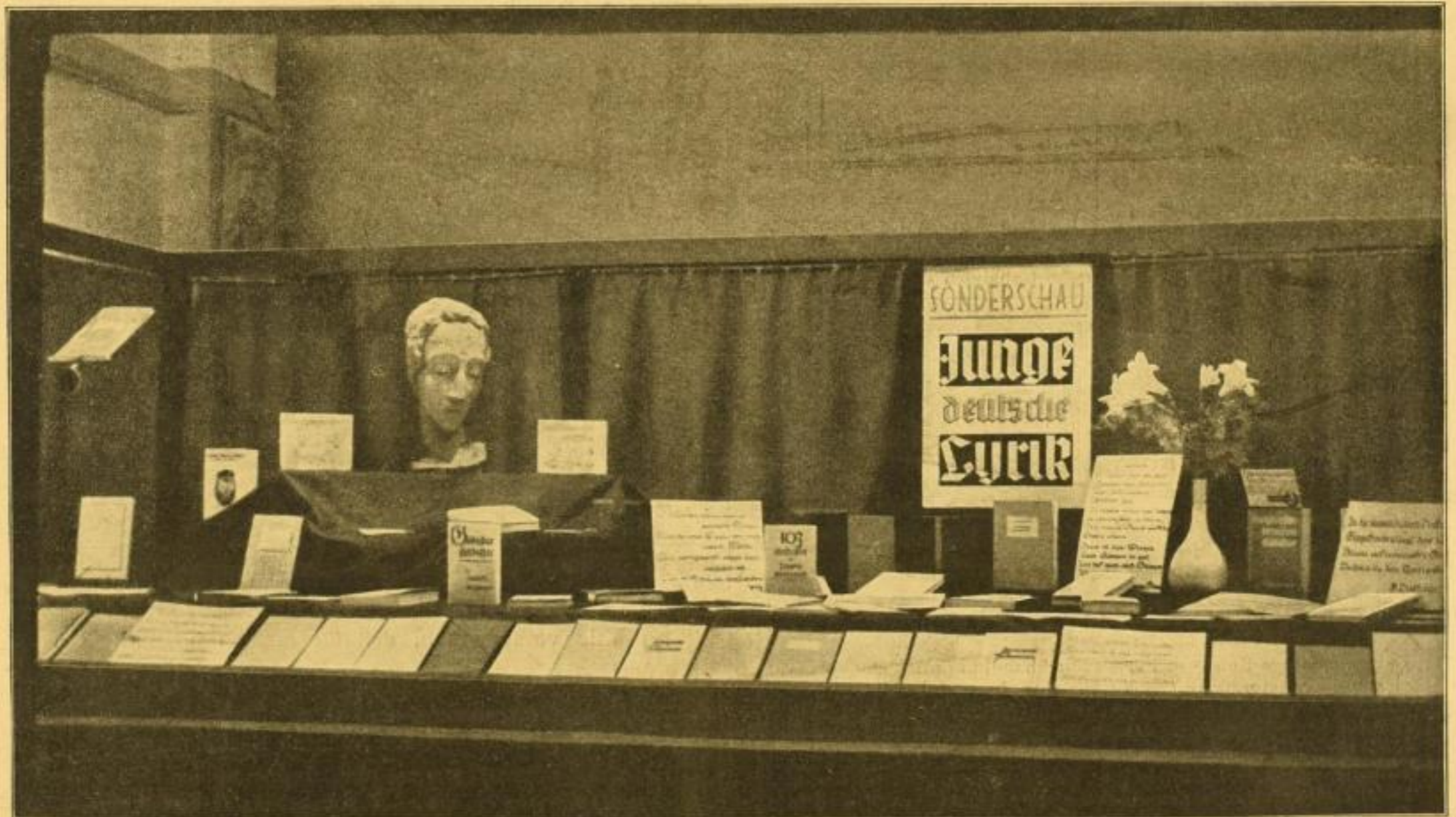
Einsender: Wolffs Bücherei, Berlin-Friedenau, Kaiserallee 133

Photos gutgelungener, überdurchschnittlicher Schauenster sind uns stets willkommen. Die Wiedergabe im Werbekalender honorieren wir mit 10 Reichsmark