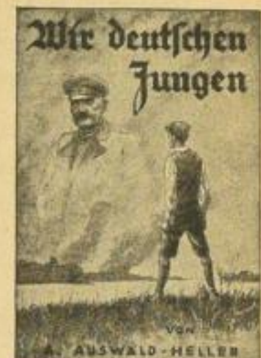
B 28 a / 2806

B 14 Vaterländische Jugendschriften: 4 Bände, 80 S., 4 Buntbilder, Halbl., je RM —.60