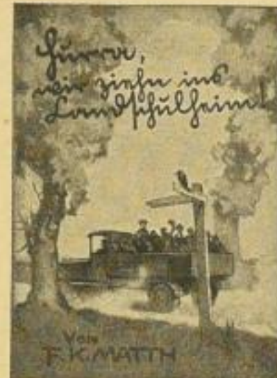
B 24 / 2418