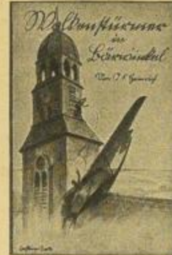
B 27 a / 2713