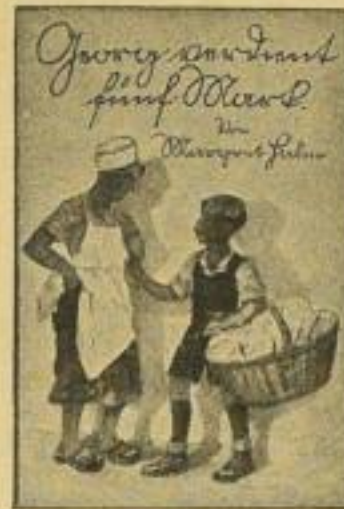
B 27 a / 2711

Die begeistert begrüßte Eine-Mark-Reihe: Neu: 8 Bände, je 80 Seiten, Buntbild und mehrere Textbilder, Halbl., Cellophanumschlag, je RM 1.—