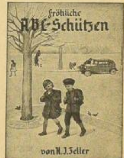
B 50 / 5063

B 50 „Das Buch der Jugend“: jezt 33 Bände, 112 S., 4 Buntbild., Lein., je RM 2.—