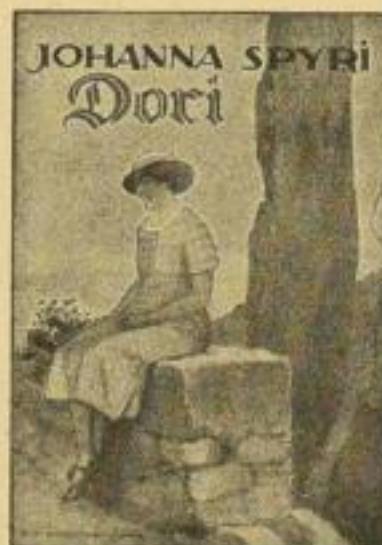
B 46 / 4639

B 46 Johanna-Spyri-Jugendschriften: „Die schöne Enzlin-Ausgabe“. Jetzt (neben 18 Ein- zelbänden, je RM 1.60) 4 Sammelbände, rund 300 Seiten, 8 Buntbilder, Halbleinen, je RM 2.40