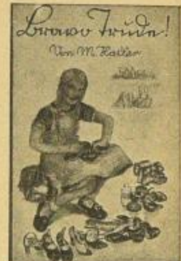
B 27 a / 2700

B 28 a Die vaterländischen Jugendschriften: jezt 6 Bände, je 112 Seiten, 3 Buntbilder, Halb- leinen, Cellophanumschlag je RM 1.20