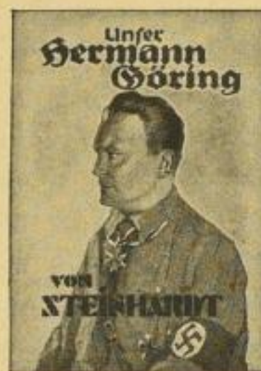
B 28 a / 2803

B 28 a Die vaterländischen Jugendschriften: jezt 6 Bände, je 112 Seiten, 3 Buntbilder, Halb- leinen, Cellophanumschlag je RM 1.20