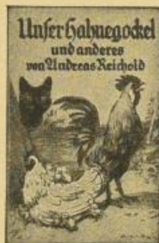
B 26 a / 2605

B 26 a „Die Bücherei des ABC-Schützen“: jezt 10 Bände, 64 Seiten, sehr viele schwarze und Farbbilder, Halbleinen je RM 1.—