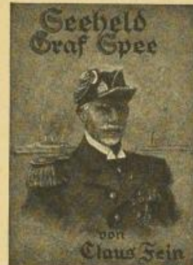
B 28 a / 2809