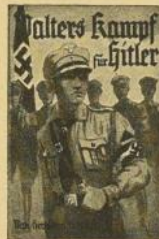
B 14 / 1414

B 14 Vaterländische Jugendschriften: 4 Bände, 80 S., 4 Buntbilder, Halbl., je RM —.60