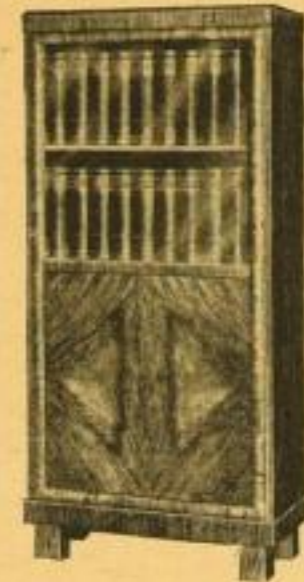
Fortuna Bücherschrank Nr. 305 knp. kaukasisch Nußbaum poliert, innen furniert, 150 cm hoch, 70 cm breit, 30 cm tief . . . 66.— ord.

Verpackung 2.— RM. Verlangen Sie Prospekt mit Nettopreisen