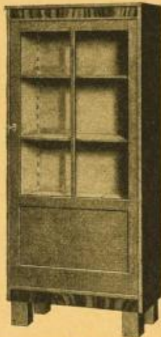
Fortuna Bücherschrank Nr. 140S. 156 cm hoch, 70 cm breit, 34 cm tief . . . 33.— ord.