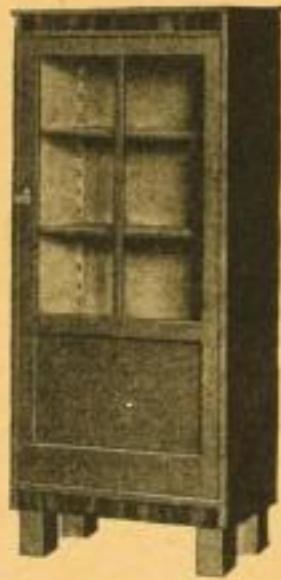
Fortuna Bücherschrank Nr. 139 137 cm hoch, 62 cm breit, 30 cm tief . . . 29.50 ord.

Beizung in natureiche, nußbaumbraun, schokoladenbraun, kaffeebraun und schwarz