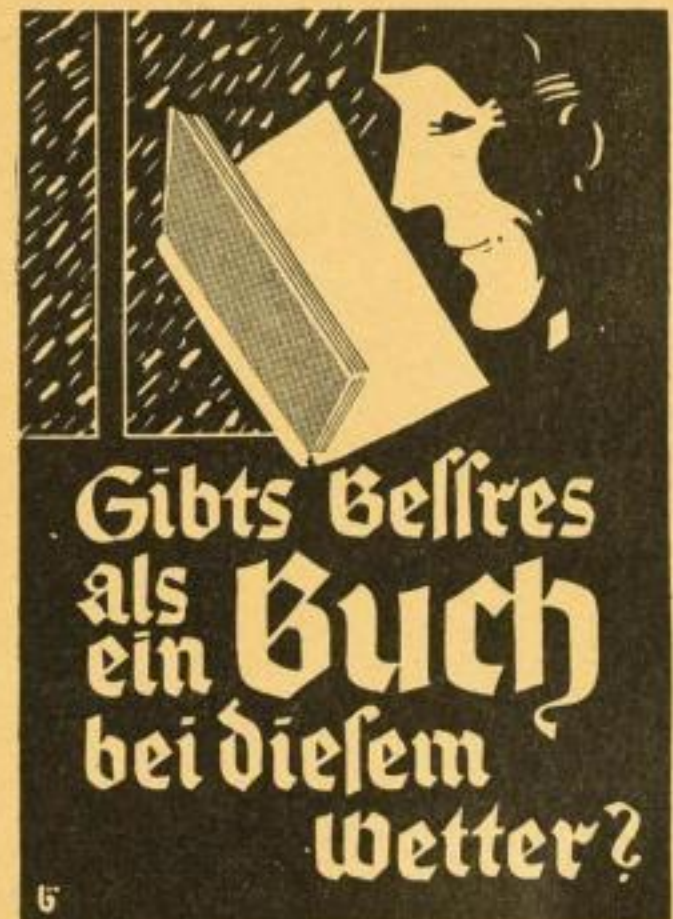
Nr. 7. Diese Mater wird unberechnet abgegeben. Angabe der Nummer genügt. Verlangen Sie bitte, auch den Matern-Auswahlbogen. Z Werbestelle des Börsenvereins der Deutschen Buchh.

Gutgelungene Aufnahmen von Schaufenstern, die in Grundgedanken und Aufbau über dem Durchschnitt stehen, aber mit einfachen und billigen Mitteln hergestellt wurden, sind uns stets willkommen. Besonders liegt uns an Bildern von Fenstern, deren Themen dem Werbekalender entnommen sind. Die Wiedergabe honorieren wir mit 10 RM.