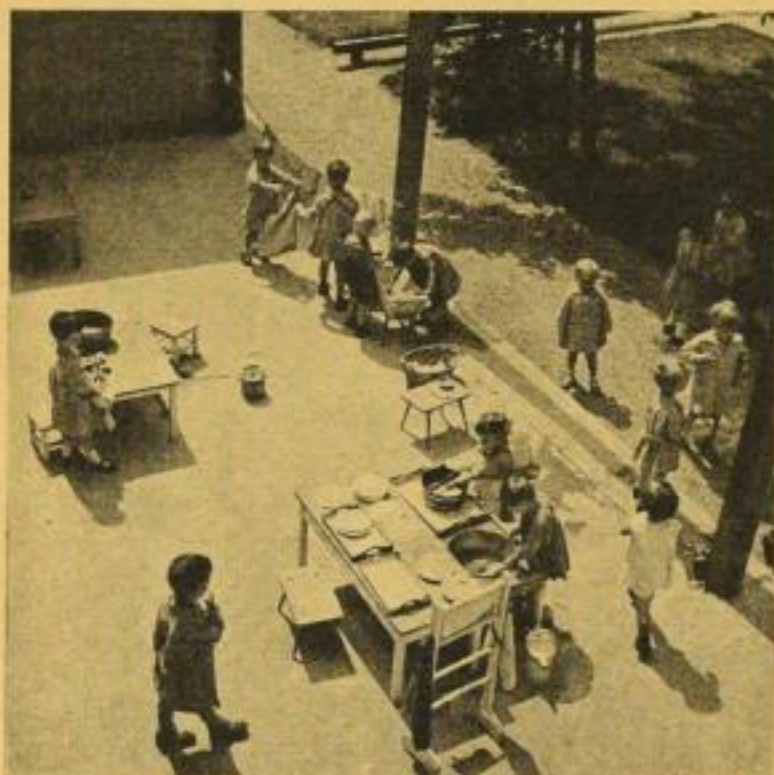
Hauswirtschaftliche Arbeiten im „Haus der Kinder“

MONATSHEFTE FÜR ARCHITEKTUR UND RAUMKUNST. XXXIII. JAHRGANG