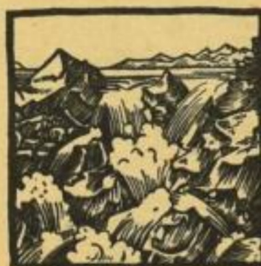
Verkleinerte Textillustrationen aus „Volksbrauch“

Setzen Sie sich für dieses erfolgreiche Buch ein, Herr Kollege! Die Zeit dafür ist jetzt besonders günstig