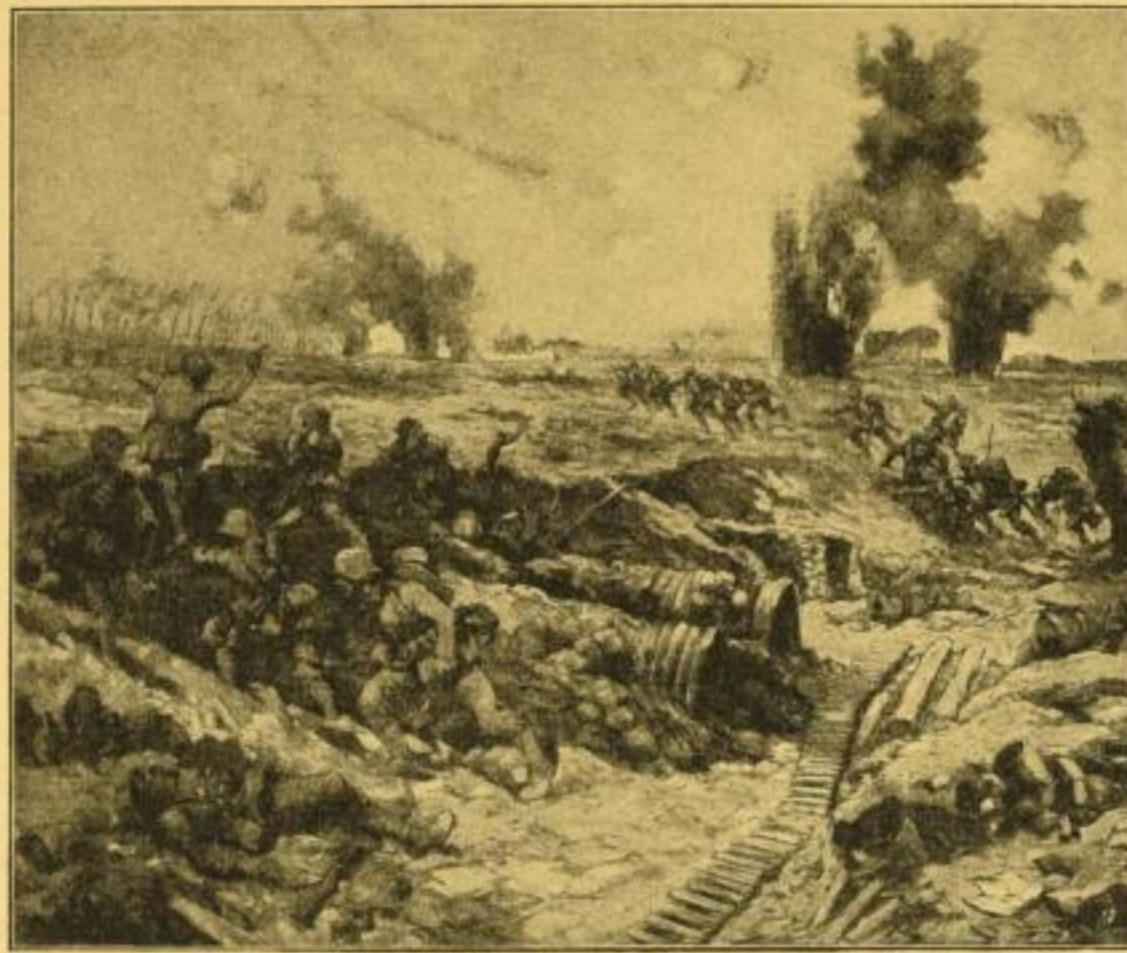
N 7705 „Angriff“

Unser Verzeichnis nationaler Bilder umfaßt 64 S. mit 2600 verschiedenen Ausgaben und wird gegen Erstattung von RM-50 Portospesen gern versandt.